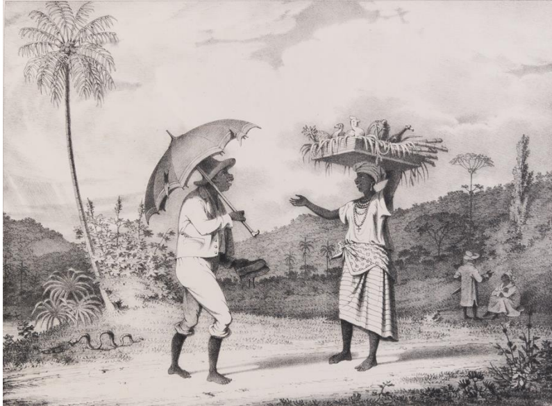
IMAGEN 3: 1836, “SUNDAY MORNING IN THE COUNTRY”; DOS PERSONAS ESCLAVIZADAS DE CAMINO A UN MERCADO DE DOMINGO. RICHARD BRIDGENS, DE MAGGS BROS. LTD.

https://www.maggs.com/west-india-scenery-with-illustrations-of-negro-character-the-process-of-making-sugar-andc_231992.htm